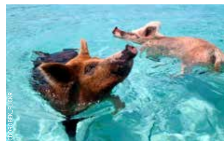
Zwemmende varkens in de Bahama's.

Wil je je echt eens in de watten laten leggen? Boek dan een cruise met het klassieke zeilschip Victoire . De Nederlandse reisorganisatie Ventus verzorgt luxe boutique cruises van een week in onder meer Sardinië en Corsica. Gedurende een week vaar je van baai naar baai en leg je aan in mooie vissersdorpjes en plaatsen als La Maddalena en Porto della Madonna. Thuishaven is de havenstad Cannigione in het noordoosten van Sardinië. Aan boord van het schip zijn een kapitein, chef-kok en één of twee bemanningsleden. De samenstelling van de gasten – zo'n acht tot twaalf – varieert. Wil je met een groep vrienden, familie of collega's een zeilcruise maken, dan kan Ventus een speciale reis voor je samenstellen. De