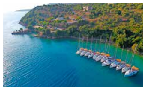
Investeringsplan voor je eigen boot in Kroatië of Griekenland.